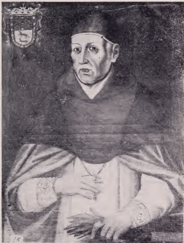
Illmo. y Rvmo. señor don Fray Luis Zapata de Cárdenas, autor del Catecismo (1576).